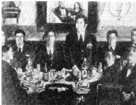
La tertulia del Pombo. Gutiérrez Solana. De pie, D. Ramón Gómez de la Serna.

Fue un gran defensor del arte de vanguardia. Cultivó todos los «ismos», pero su invención más popular fueron Las Greguerías (1910). Estaba dotado de una poderosa imaginación capaz de transformar en literatura cualquier detalle de la vida cotidiana.